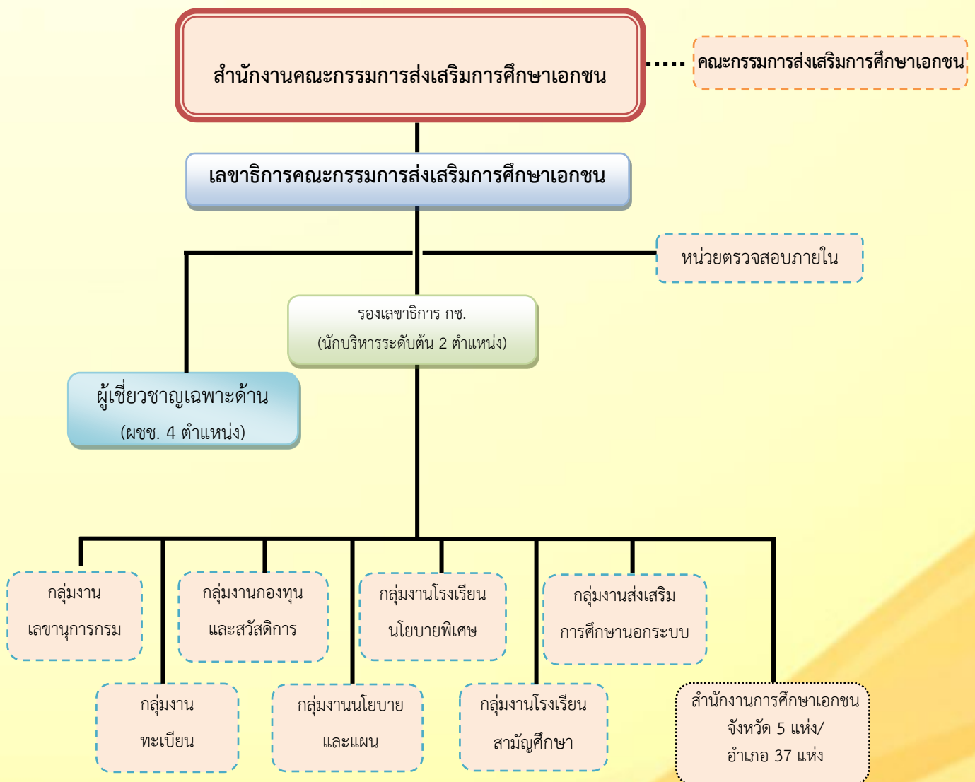
ภาพ แสดงโครงสร้างของสำนักงานคณะกรรมการส่งเสริมการศึกษาเอกชน

มาตรา 14 แห่งพระราชบัญญัติโรงเรียนเอกชน พ.ศ. 2550 แก้ไขเพิ่มเติม (ฉบับที่ 2) พ.ศ. 2554 กำหนดให้มีสำนักงานคณะกรรมการส่งเสริมการศึกษาเอกชนในสำนักงานปลัดกระทรวงศึกษาธิการ โดยมีเลขาธิการคณะกรรมการส่งเสริมการศึกษาเอกชนซึ่งมีฐานะเป็นอธิบดีและเป็นผู้บังคับบัญชาข้าราชการ พนักงานและลูกจ้าง และรับผิดชอบการดำเนินงานของสำนักงานคณะกรรมการส่งเสริมการศึกษาเอกชน ปัจจุบันสำนักงานคณะกรรมการส่งเสริมการศึกษาเอกชน มีโครงสร้าง ดังนี้